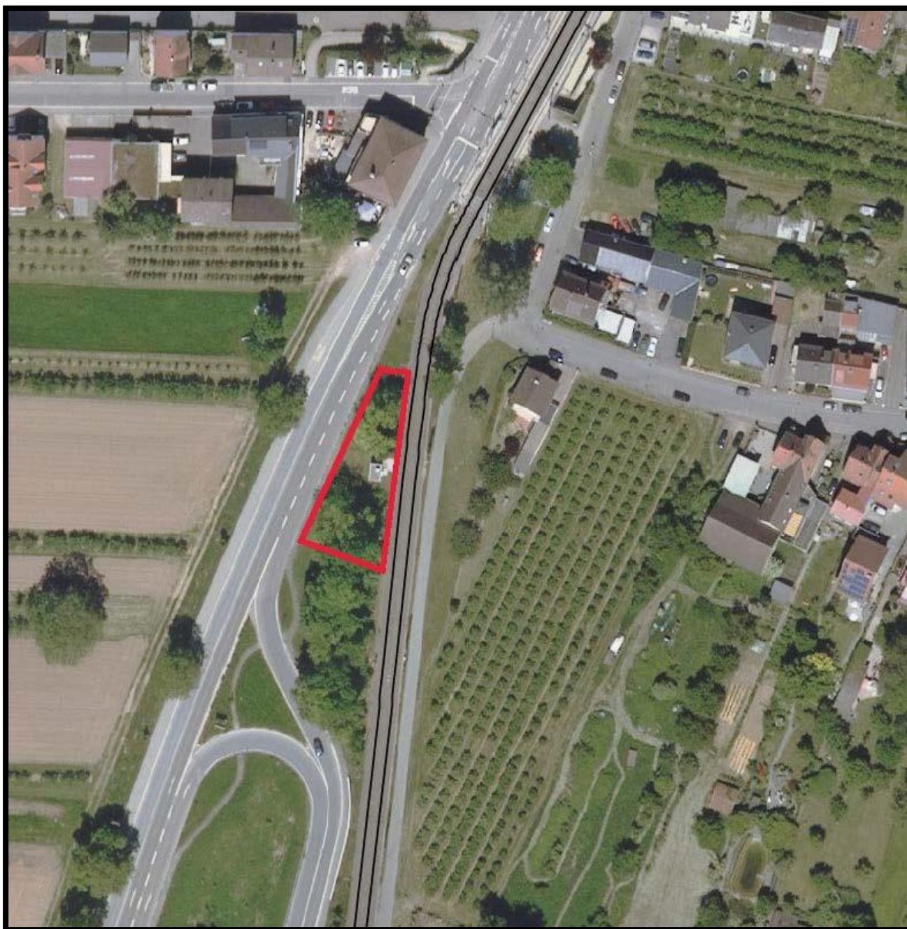
Abbildung 1: Geplanter Standort für das Gleichrichterunterwerk (rot markiert)