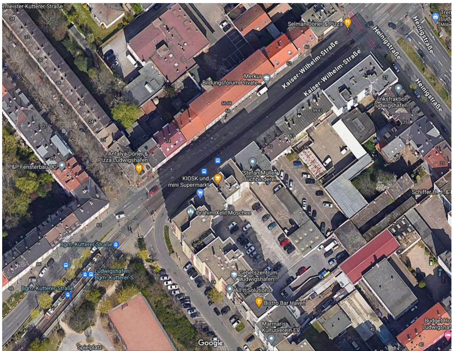
Erfasster Bildschirmausschnitt: 26.03.2024 11:32