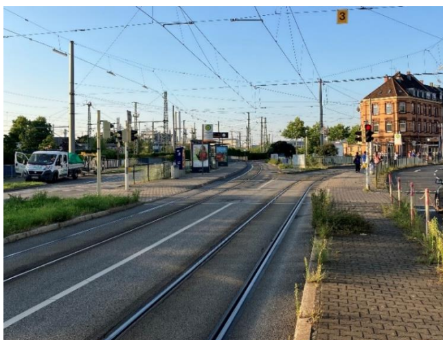
Abbildung 2: Bahnsteige (Blick aus Richtung Norden)