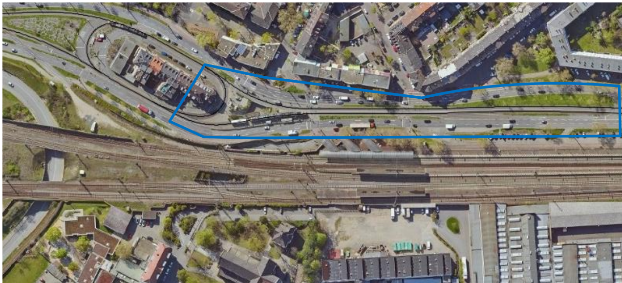
Abbildung 4: Luftbild, mit erweitertem Planungsbereich (inkl. Folgemaßnahmen) der Haltestelle Waldhof Bf

Zusätzliche Leistungen aufgrund geänderter Variantenverfolgungen sind in der Kalkulation zu berücksichtigen.