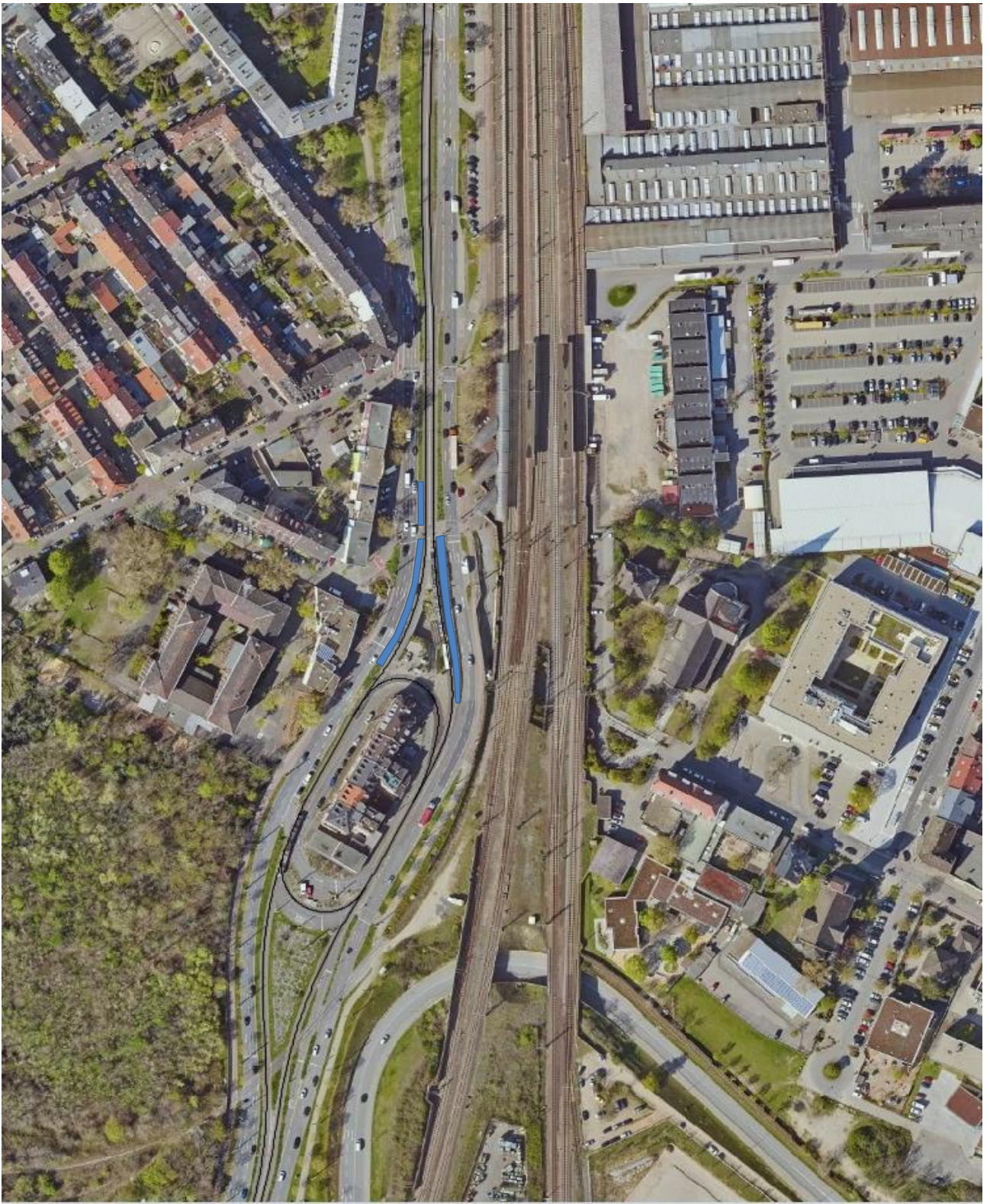
Abbildung 1: Luftbild, Streckenverlauf der Stadtbahnlinie 1 mit der heutigen Haltestelle Waldhof Bf