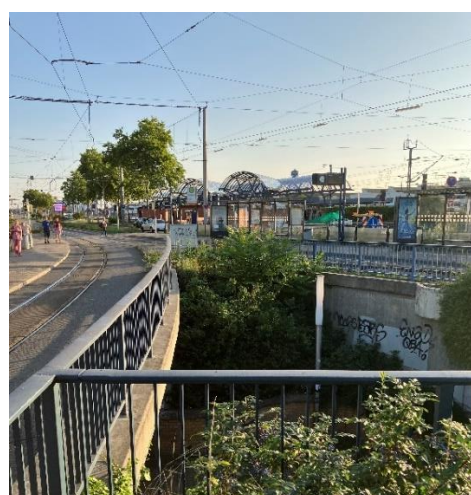
Abbildung 3: DB-Bahnhof Waldhof und Brücken (Blick aus Richtung Süden)