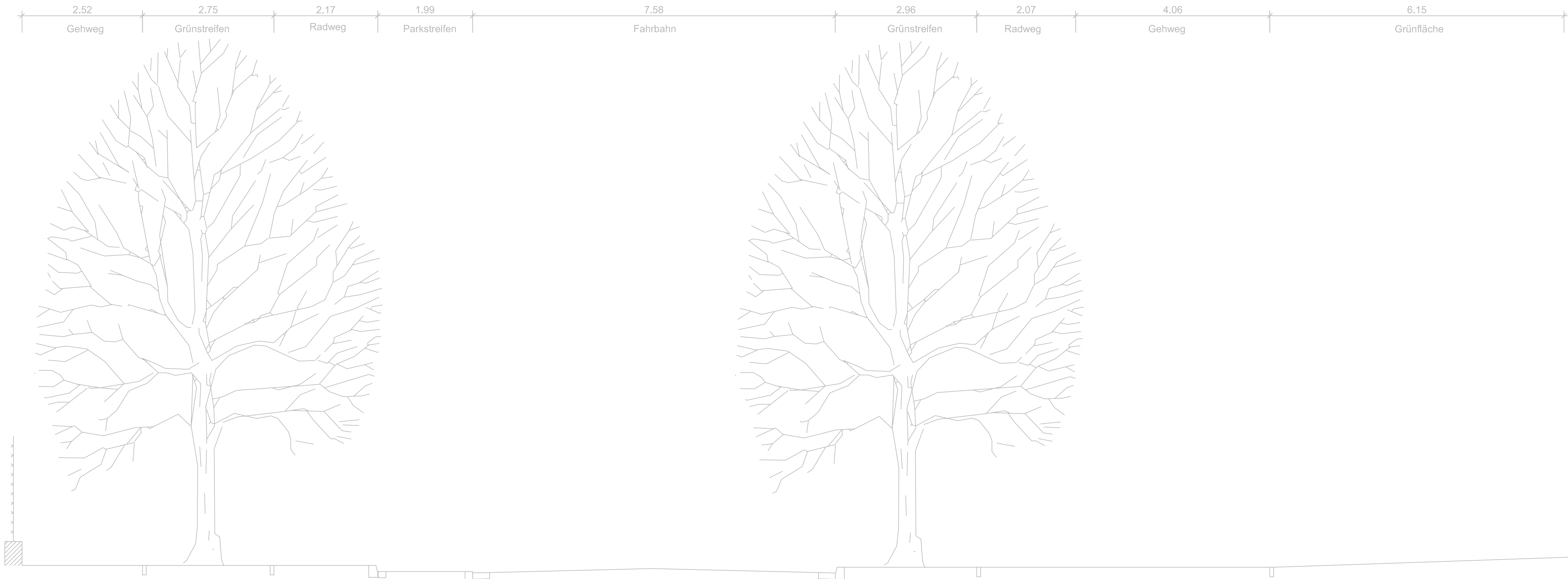
Ausbauquerschnitt 3 Station km: 100 + 915,878