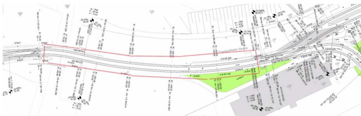
Abbildung 4: Bereich der Gleiserneuerung

Das bestehende Schottergleis auf Holzschwellen wird als offenes Schottergleis mit Betonschwellen hergestellt. Die Erneuerung soll auf einer Länge von ca. 130 m ausgeführt werden. Der Bereich zieht sich circa vom Anfang der beiden Weichen 813/814 bis unter die Brücke der Bundesstraße 44. Durch die Erneuerung des Oberbaus wird eine bessere Lagestabilität und eine längere Nutzungsdauer gegenüber dem Altzustand gewährleistet.