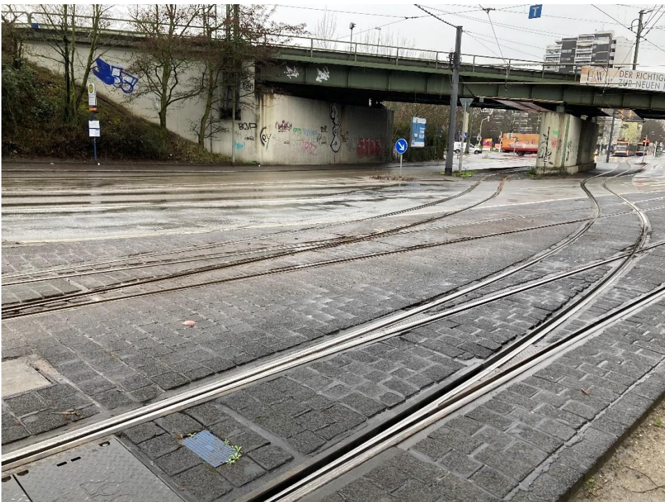
Abbildung 3: W813/814 und Kr813 am Übergang Lorientallee und Frankenthaler Straße

Die Gleisanlage stammt aus den 1970ern und besteht aus Gleisen des Schienenprofils S41 auf Holzschwellen im Schotter. Die Kopfabnutzung und der Seitenverschleiß sind sehr stark ausgeprägt. Die Lagestabilität ist durch einen schlechten Untergrund kaum vorhanden.