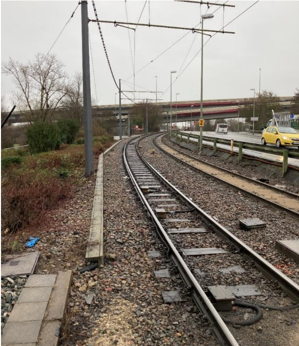
Abbildung 2: Bestandstrasse in der Lorientallee

Die Gleisanlage stammt aus den 1970ern und besteht aus Gleisen des Schienenprofils S41 auf Holzschwellen im Schotter. Die Kopfabnutzung und der Seitenverschleiß sind sehr stark ausgeprägt. Die Lagestabilität ist durch einen schlechten Untergrund kaum vorhanden.