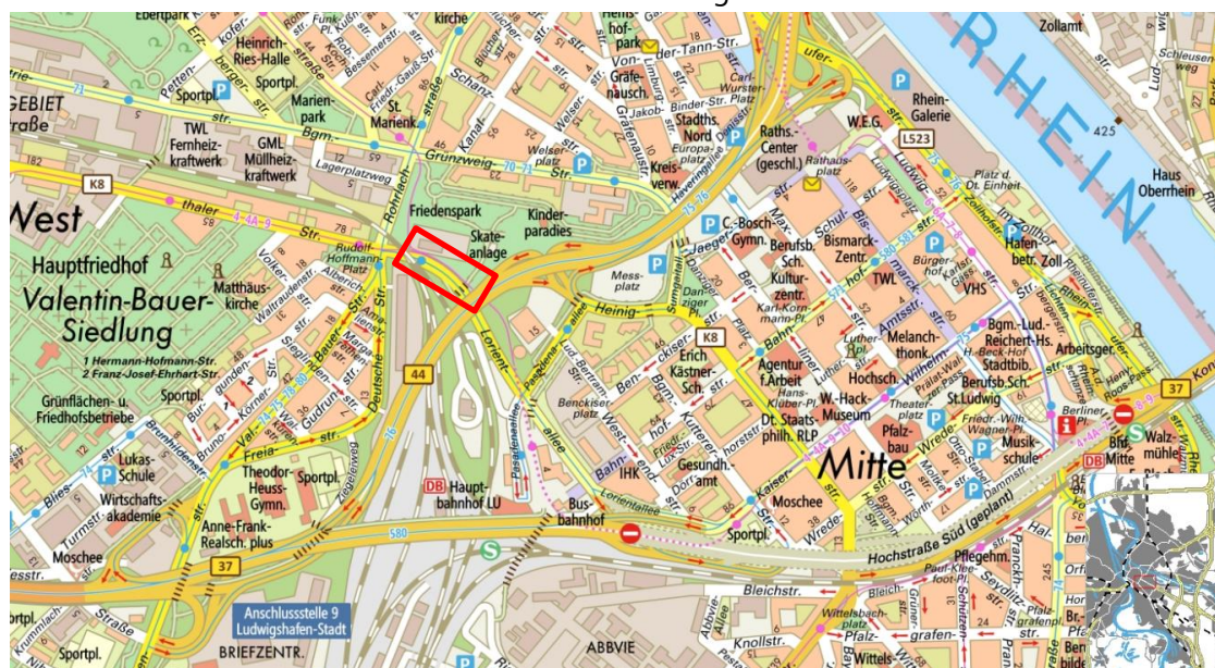
Abbildung 1: Übersichtslageplan

Insbesondere die Linie 4 sowie die Expresslinie 9 verkehren aus dem Mannheimer Stadtgebiet über die Stadt Ludwigshafen auf die RHB und enden bzw. beginnen in der Stadt Bad Dürkheim. Neben weiteren Aus- und Umbauten gilt es auch, das Bestandsnetz kontinuierlich instand – und somit leistungsfähig – zu halten. Dies wird nach den anerkannten Regeln der Technik regelmäßig durch die rnv im Auftrag ihrer Muttergesellschaften durchgeführt. Trotz dieser umfassenden und auch finanziell aufwändigen Maßnahmen ist die Lebensdauer der Infrastruktur begrenzt.